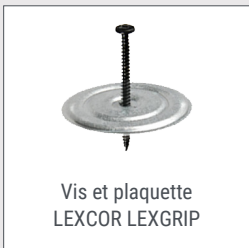
Vis et plaquette LEXCOR LEXGRIP