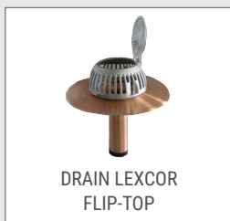
DRAIN LEXCOR FLIP-TOP