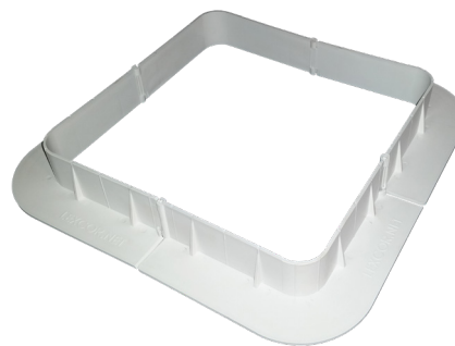
Carré 305 mm x 305 mm (12" x 12")