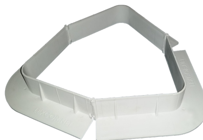
Triangle 229 mm (9")