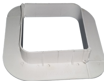
Carré 152 mm x 152 mm (6" x 6")

Les propriétés et les résultats varieront selon les conditions environnementales et la technique d'application.